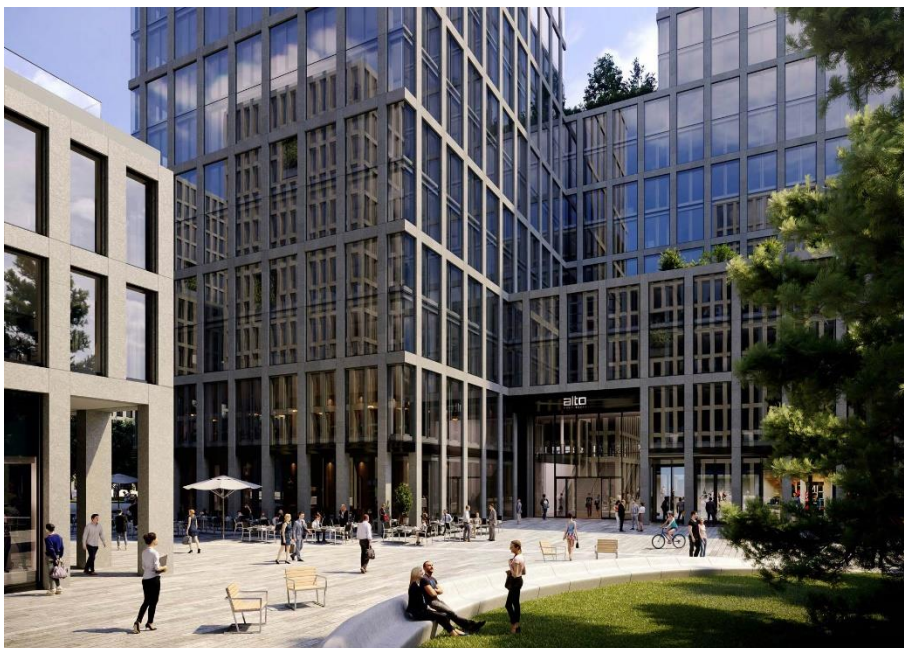
Alto Pont-Rouge vient compléter le nouveau quartier autour de la gare de Lancy-Pont-Rouge.