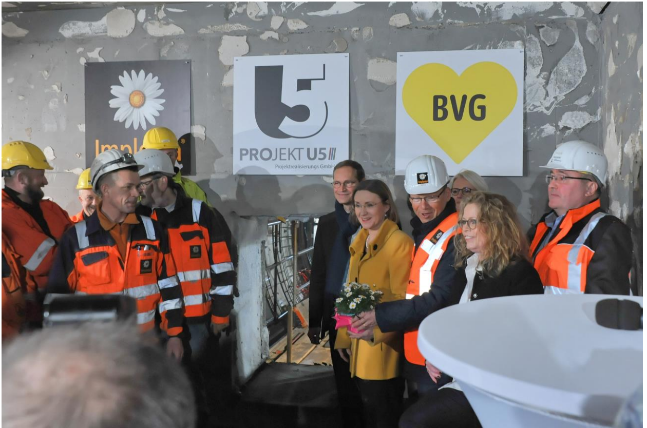
La percée est réalisée: à Berlin, Implenia effectue la jonction entre la ligne U55 et la ligne U5.