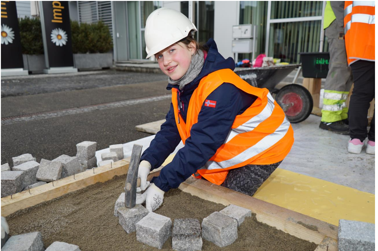
Lors de la Journée nationale Futurs en tous genres chez Implenla, les filles ont pu découvrir de près le travail quotidien d'une maçonne ou d'une constructrice de routes.