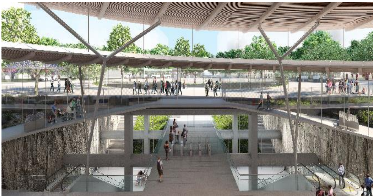
Ansicht des Bahnhofs Noisy Champs.