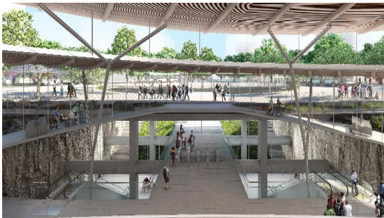
Vue de la gare de Noisy-Champs.