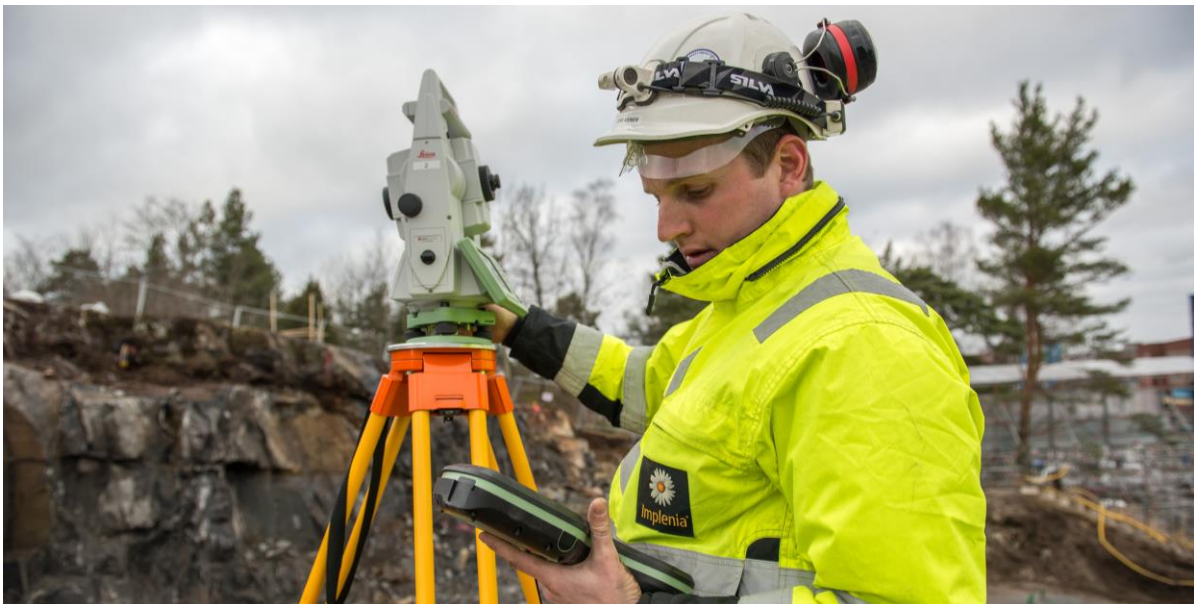
Implenia wurde mit der Realisierung des „Lunda Tunnels“ beauftragt. Dabei handelt es sich um einen weiteren Bauabschnitt der Stadtumfahrung E4 Förbifart, bei der sich Implenia im August 2015 bereits den Auftrag für den „Johannelund Tunnel“ gesichert hatte.

Dietlikon, 25. August 2016 – Implenia hat in Schweden zwei neue Aufträge im Gesamtwert von rund CHF 60 Mio. (SEK 523 Mio.) gewonnen. Bei den akquirierten Projekten handelt es sich um komplexe Infrastrukturbauten für die schwedische Vergabebehörde Swedish Transport Administration (Trafikverket). Unter anderem wurde Implenia bei Stockholm mit der Realisierung eines zweiten Bauabschnitts der Stadtumfahrung E4 Förbifart beauftragt. Der heute unterzeichnete Vertrag für das Los FSE 410 „Lunda Tunnel“ beinhaltet den Bau von zwei 1,6 Kilometer langen, parallel verlaufenden Tunnelröhren. Das Bauwerk schliesst im Süden an den „Johannelund Tunnel“ (Los FSE 403) an, für den Implenia im August 2015 den Auftrag gewonnen hatte und für den derzeit die Vorbereitungsarbeiten laufen. Der „Lunda Tunnel“ weist ein Investitionsvolumen von rund CHF 57 Mio. (SEK 500 Mio.) auf. Er wird zusammen mit dem „Johannelund Tunnel“ voraussichtlich 2021/2022 der Bauherrschaft übergeben. Implenia verfügt dank der erfolgreichen Akquisition der Schwedischen Bilfinger Construction Einheiten über einen guten Marktzugang und konnte sich nach dem Gewinn des Johannelund-Tunnels bereits ihren zweiten wichtigen Auftrag in Schweden sichern.