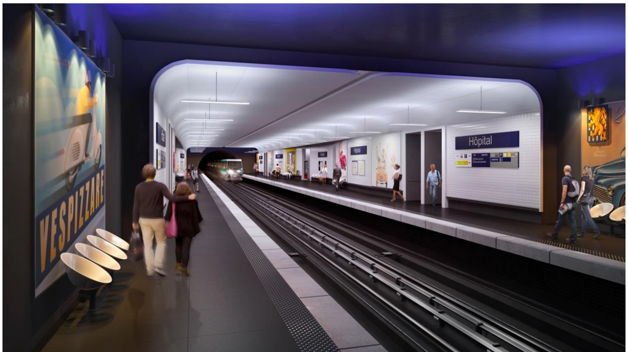
En remportant le contrat du prolongement de la ligne de métro n° 11 à Paris, Implenla contribue à améliorer les liaisons entre l'Île-de-France et la capitale française à partir de 2030. Vue projetée de la future station Hôpital.