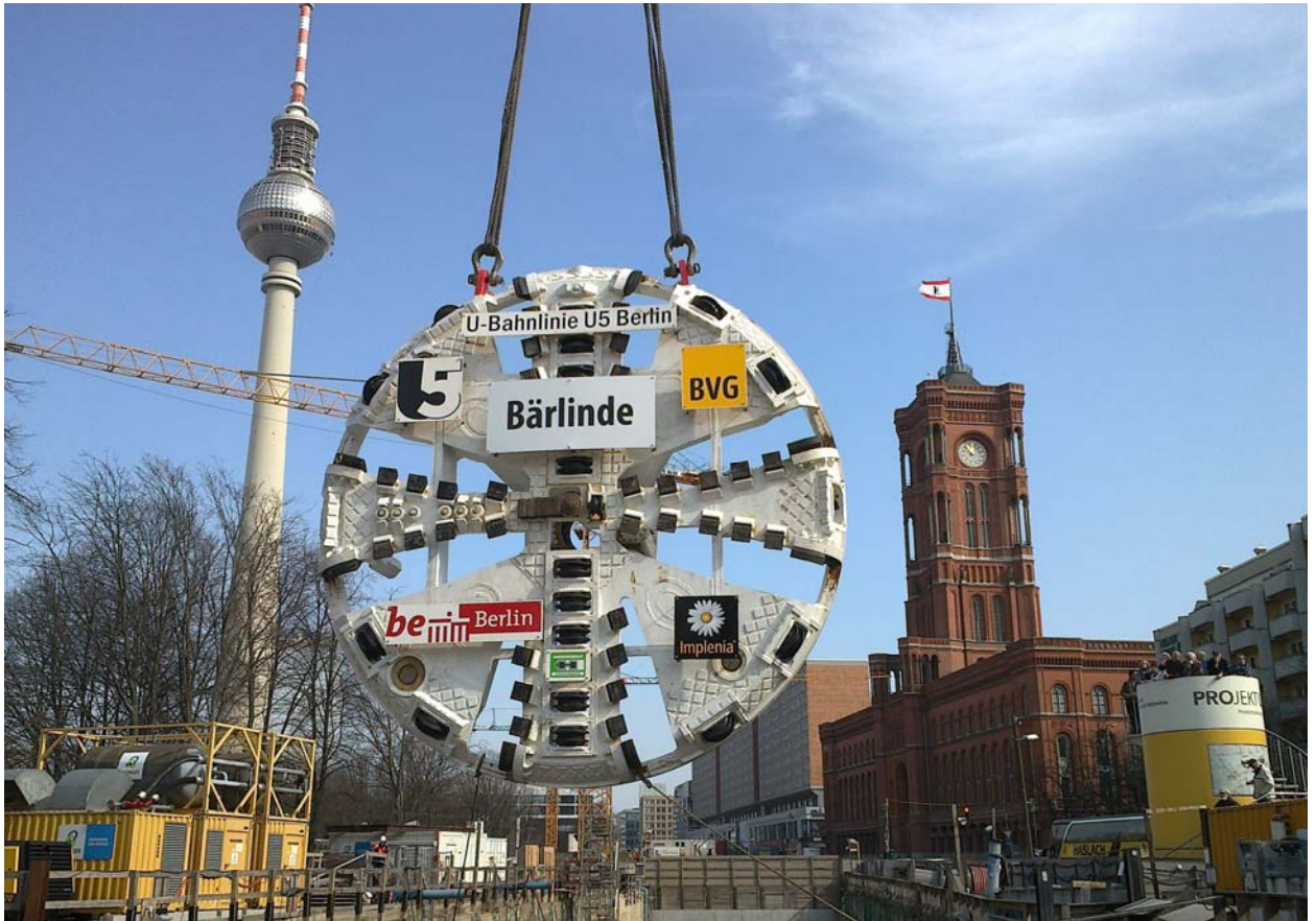
Die 74 Meter lange und 700 Tonnen schwere Tunnelbohrmaschine „Bärinde“ arbeitete sich nach Unterquerung von Spree, Humboldtforum und Spreekanal unterhalb des Boulevards Unter den Linden hindurch bis zum U-Bahnhof Brandenburger Tor. Mehr Informationen zu „Bärinde“ finden Sie hier .