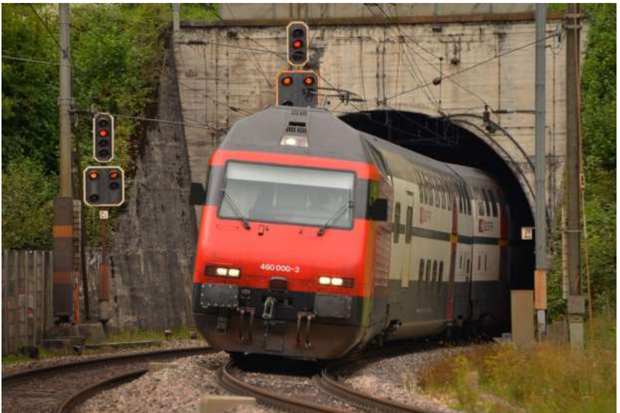
Hier am Südportal bei Schinznach-Dorf startet ab Frühjahr 2016 der Tunnelvortrieb für den Bau des neuen Bözberg-Eisenbahntunnels.