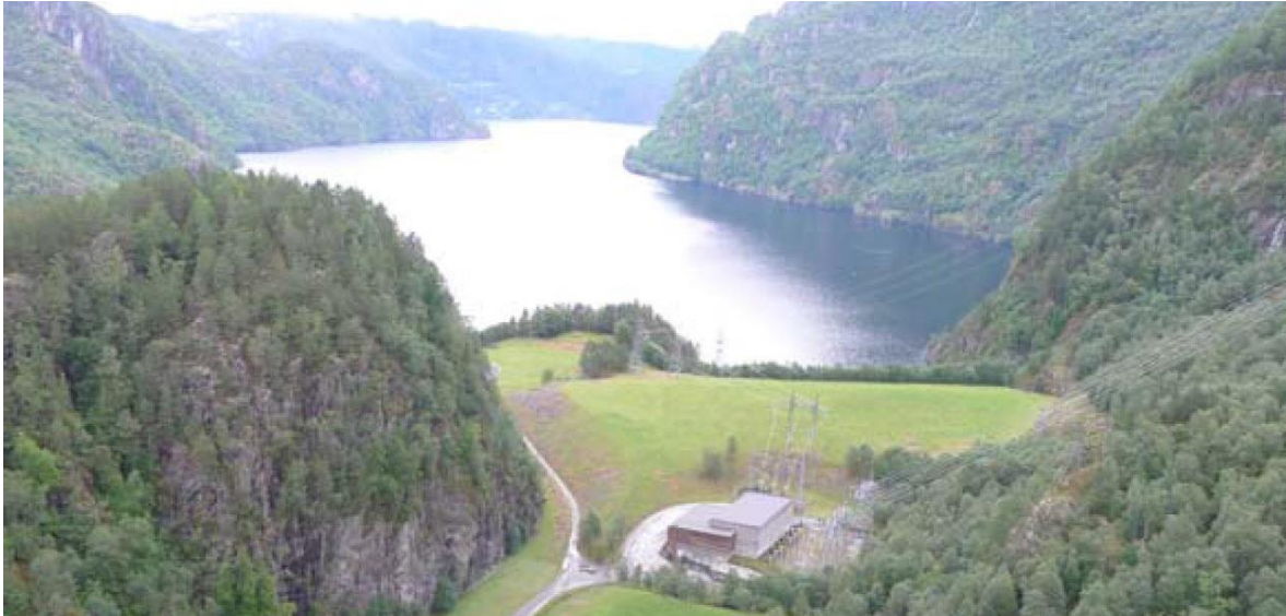
Implenia baut mit Tunnel- und Tiefbauleistungen beim norwegischen Kvilldal (Bild) an der künftigen neuen Seekabelleitung zwischen Grossbritannien und Norwegen mit.