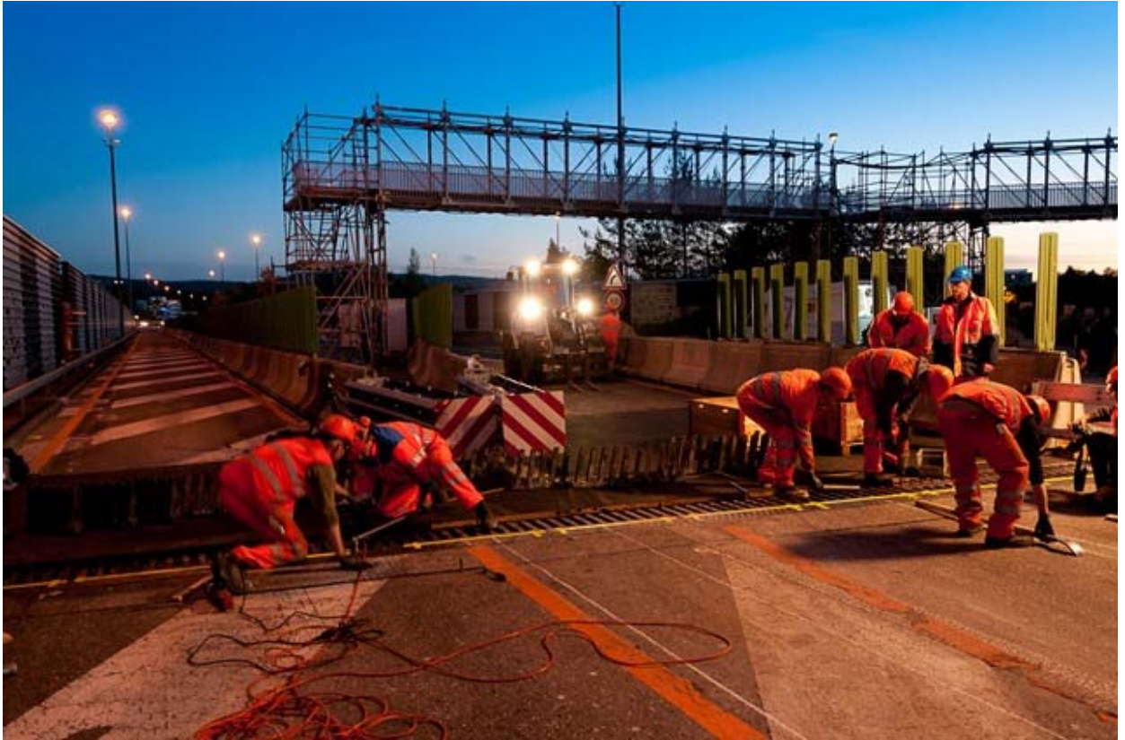
Chaque nuit, la circulation de l'échangeur de Brüttisellen a été déviée, et on a travaillé au relèvement des piliers de pont jusqu'à 5 heures du matin.