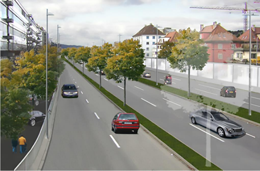
Visualisierung Autobahnanschluss «N01/36 Schlieren-Europabrücke» in Zürich-Grünau (Bild: Bundesamt für Strassen ASTRA).