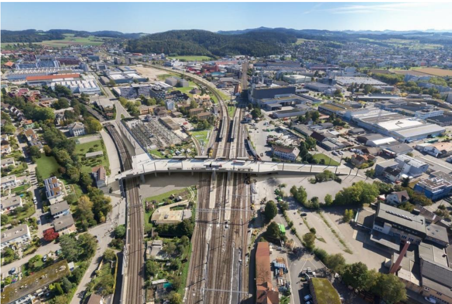
Künftige Verkehrsdrehscheibe in Winterthur Neuhegi: die Querung Grütze.