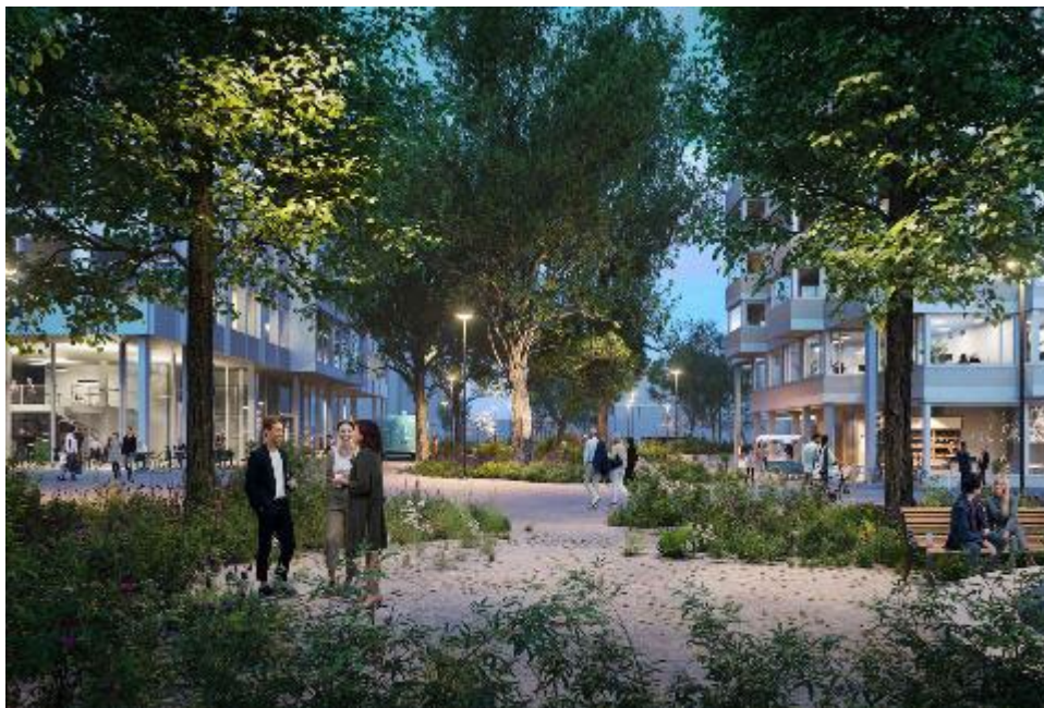
Bild: Im Unterfeld entsteht ein parkähnlicher Aussenraum mit vielen schönen Orten wie Alleen, Innenhöfen und Plätzen zum Spazieren und Verweilen Visualisierung Quartierplatz an der Stadtbahnhaltestelle (1. Etappe)

Bilder zum Download: https://vault.creafactory.ch/index.php/s/x6ia5d722CKGPQs