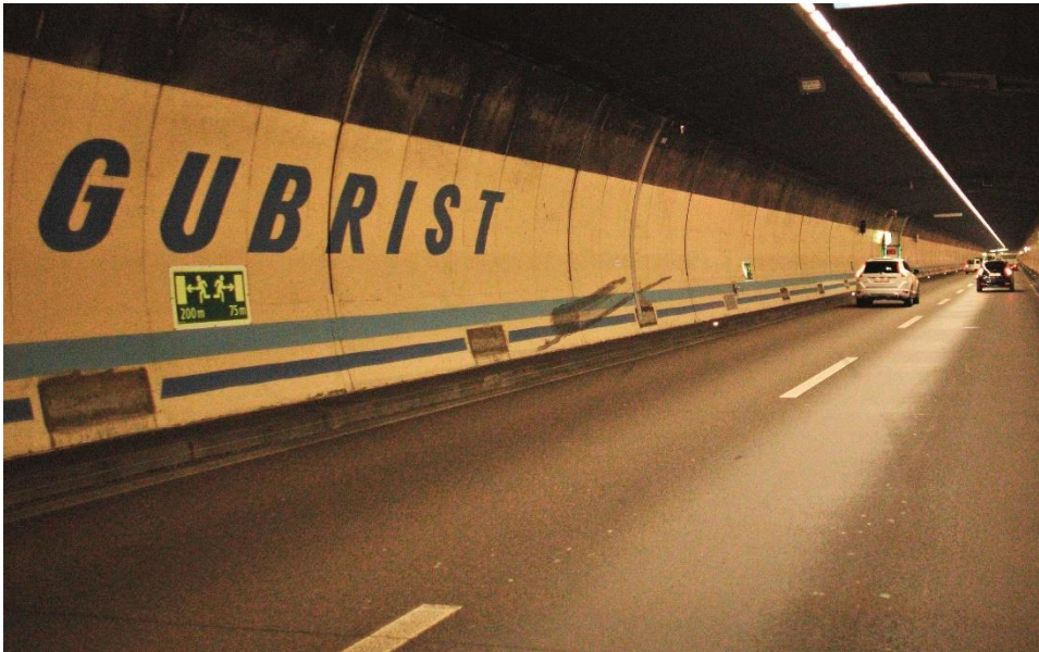
Le tunnel du Gubrist est l'un des tunnels routiers les plus fréquentés de Suisse et les deux tubes existants sont en service depuis 1985.