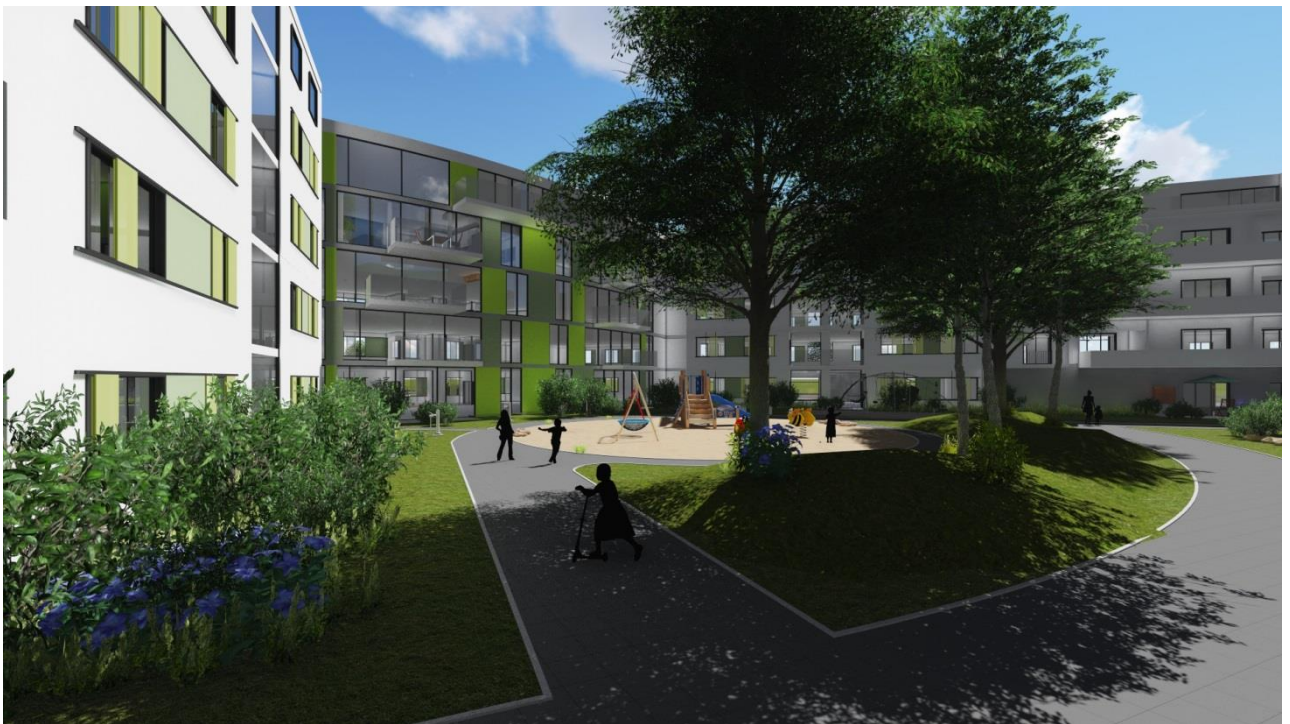
Mittels Implenia VR realisierte Ansicht des Innenhofs beim Projekt Christian-Weiß-Siedlung in Karlsruhe.