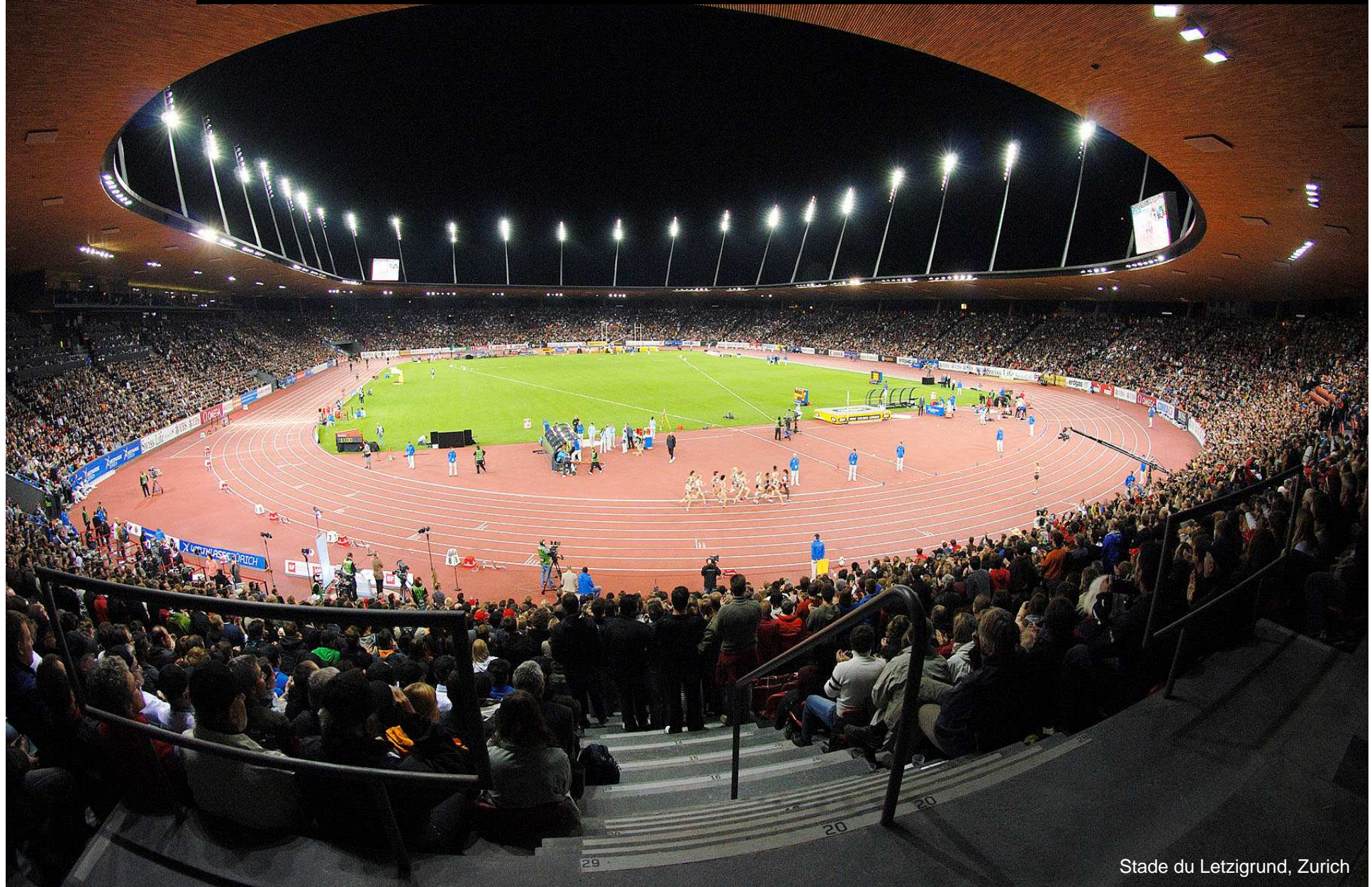
Stade du Letzigrund, Zurich