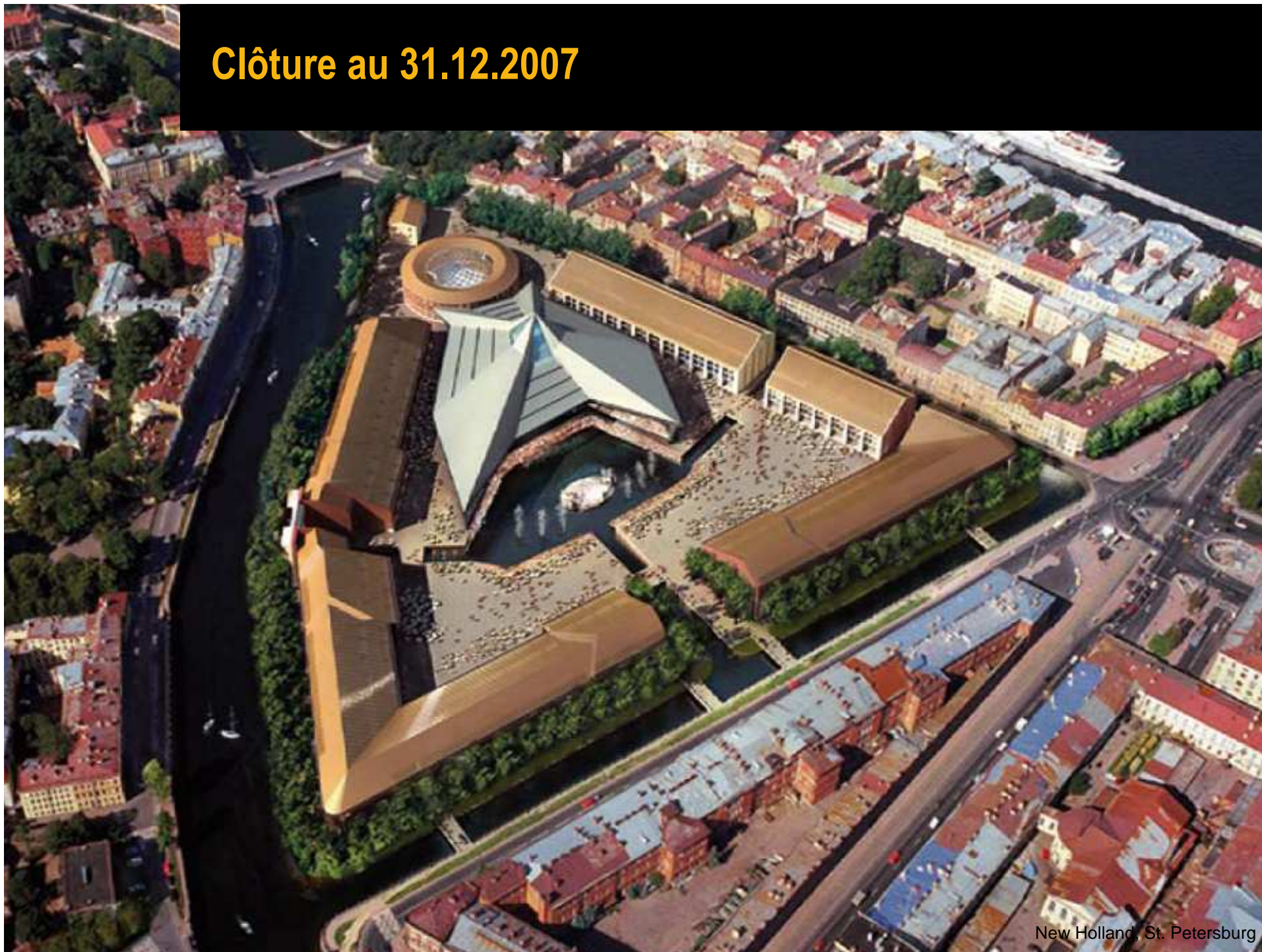
New Holland, St. Petersburg