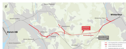
Orientierender Projektüberblick Brüttenertunnel für Ausschreibung. 423